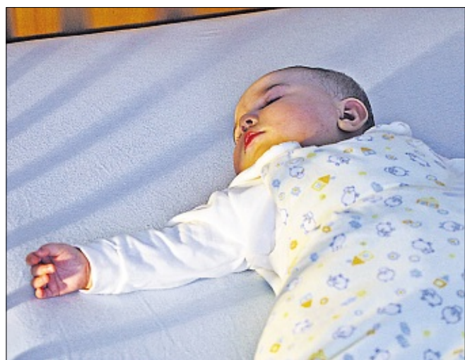
Manchmal möchte das Baby nur eines – seine Ruhe.