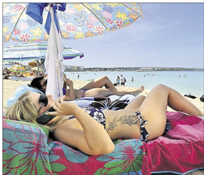
Außerhalb der Europäischen Union kann es sich lohnen, mit der SIM-Karte eines Reise-Discounters zu telefonieren.

(dpa) • Kreuzfahrtpassagiere sollten für Telefonate auf See versuchen, sich manuell in das Handy-Netz des nächstgelegenen Landes einzuwählen. Das sei häufig möglich und allemal billiger, als das Schiffsnetz zu benutzen. Darauf weist das Telekommunikationsportal teltarif.de hin. Wer lieber während der Landgänge telefoniert, ist gerade außerhalb der Europäischen Union in vielen Fällen mit der SIM-Karte eines sogenannten Reise-Discounters gut bedient. Abgehende Gespräche sind den Angaben zufolge je nach Land und Anbieter bei Nutzung des sogenannten Call-back-Verfahrens zu Minutenpreisen ab 29 Cent möglich. Allerdings bieten die Discounter nicht in jedem Staat die billigste Lösung, so dass sich der Urlauber am besten vorher informiert.