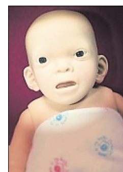
Diese Puppe zeigt, wie ein mit dem Fetalen Alkoholsyndrom geborenes Baby aussehen kann.

sie kann mit Veränderungen und spontanen Plänen schlecht umgehen und ist von anderen Menschen leicht zu beeinflussen. Wie alle diese Kinder ist sie sehr leichtgläubig.“ Darin liegt eine große Gefahr, die einen besonderen Schutz erfordert.